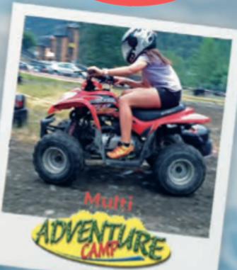
Multi ADVENTURE CAMP