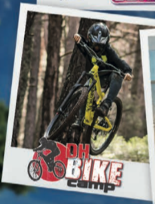
OH BIKE camp