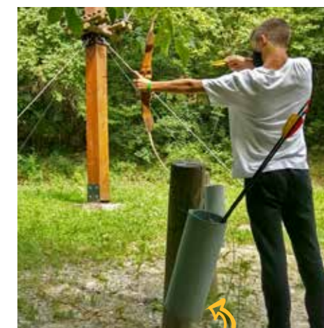
TIRO CON ARCO