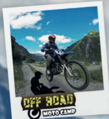
OFF ROAD MOTO CAMP