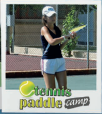
Tennis paddle camp